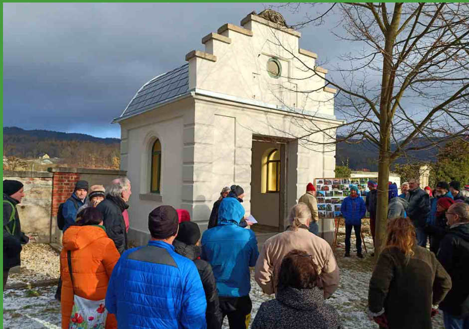
Setkání u obnovené hrobky Neuhäuser–Berger v Oldřichově v Hájích.