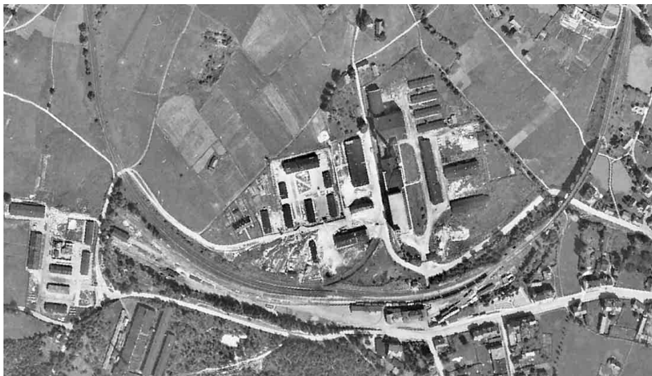
Arbeitslager Reichenau a zbrojní továrna Getewent na leteckém snímku z roku 1946.

Pobočných táborů nebo menších pracovních komand velkých nacistických lágrů vzniklo v okupované střední Evropě zhruba tisíc. Pietními místy je připomenuta pouze menšina z nich, přičemž většinou jde o jeden pomníček, pamětní desku nebo čestný hrob. A právě v tomto ohledu je rychnovský tábor výjimkou – od skončení války až dodnes ve městě vyrostlo postupně devět pamětních objektů, čímž je bývalý lágr Reichenau pravděpodobně nejvíce „opomníčkovaným“ pobočným táborem vůbec.