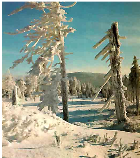
Takto Siegfried Weiss zachytil vrchol Jizersy ze Smědavské hory. Pressfoto 1976

Zájemci si výstavu mohou prohlédnout do 2. dubna 2023.