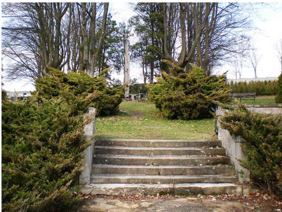
Společný hrob obětí na rychnovském hřbitově.

Druhý, a tentokrát už trvalý pietní objekt, vznikl v roce 1950 na rychnovském hřbitově. V době fungování tábora bylo zvykem, že zemřelí vězňové byli posíláni ke zpopelnění do libereckého krematoria nebo do krematoria v koncentračním táboře Groß-Rosen. V chaotických poměrech na konci války to už ale nebylo možné, a proto byli mrtví provizorně pohřbíváni na vnější straně zdi městského hřbitova nebo na jiných místech v oblasti Rychnova (podle kroniky 16 osob). Po válce se těmto obětem dostalo pietního obřadu a v roce 1946 jim byl zřízen důstojnější hrob, prozatím bez pamětního objektu.