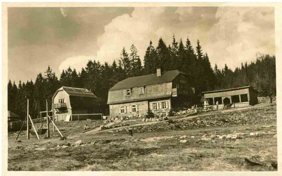
Krömerova bouda v době největší popularity. Zcela vpravo původní zahradní domek. Pohlednice