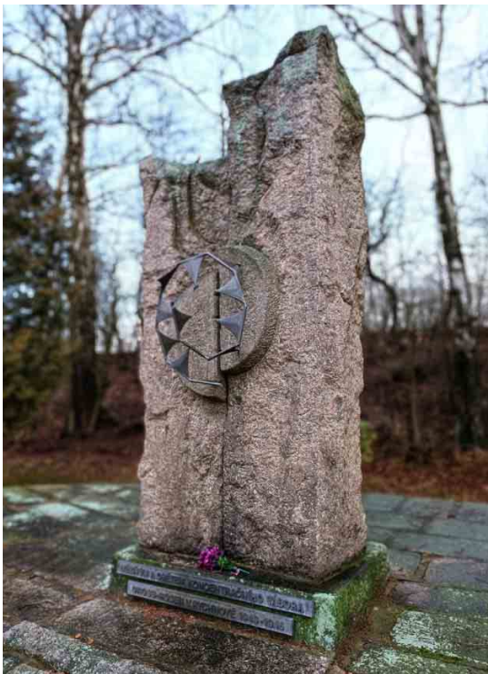
Pomník u nádraží představuje muže a ženu, kteří se již nikdy nesejdou.