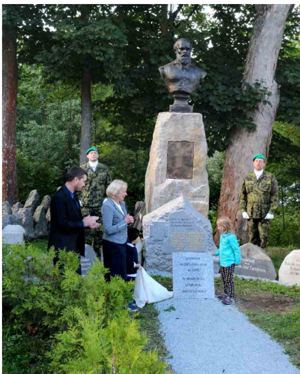
Slavnostní odhalení Jahnova pomníku a pamětní desky obětem všech válek na světě.