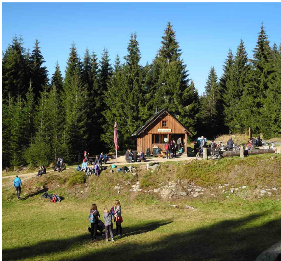
Za hezkých dnů bývá současná Krömerova bouda v obležení návštěvníků.