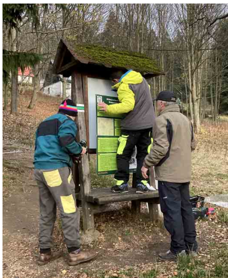
Oprava informační tabule na začátku křížové cesty.

Křížovou cestu z Horního Maxova na Slovanku a k Seibtově studánce Spolek Patron kompletně obnovil v letech 2010–2011. Dne 3. listopadu 2013 jí požehnal farář Pavel Aichler.