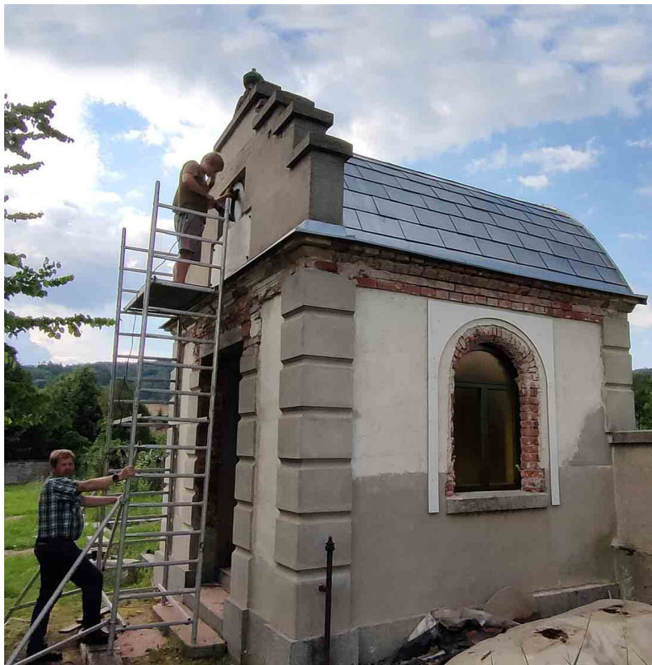
V létě roku 2021 už byla obnova venkovní fasády dobře patrná.

Po odsunu německých obyvatel se o hrobku nikdo nestaral. V roce 2004 začal někdo systematicky „loupat“ měděnou střešní krytinu, a i přesto, že na to bylo vedení obce upozorněno, dotyčnému v kompletní krádeži plechové střechy nikdo nezabránil. Střechu hrobky bylo v té době potřeba znovu pokrýt. To se ale nestalo, stará německá hrobka nikoho nezajímala, a tak objekt chátral dál. V té době střechu chránil už jen dřevěný krov.