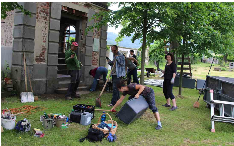
Každý, kdo mohl, přiložil rád ruku k dílu.