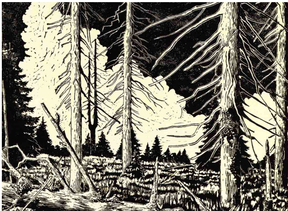
Prales na hoře Jizeře, lynorit (výřez) Siegfrieda Weisse. Rodinný archiv