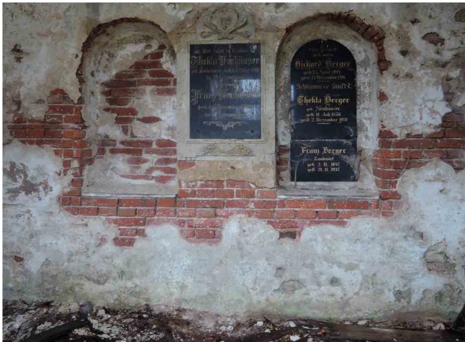
Zanedbaný byl i interiér s dochovanými náhrobními deskami.