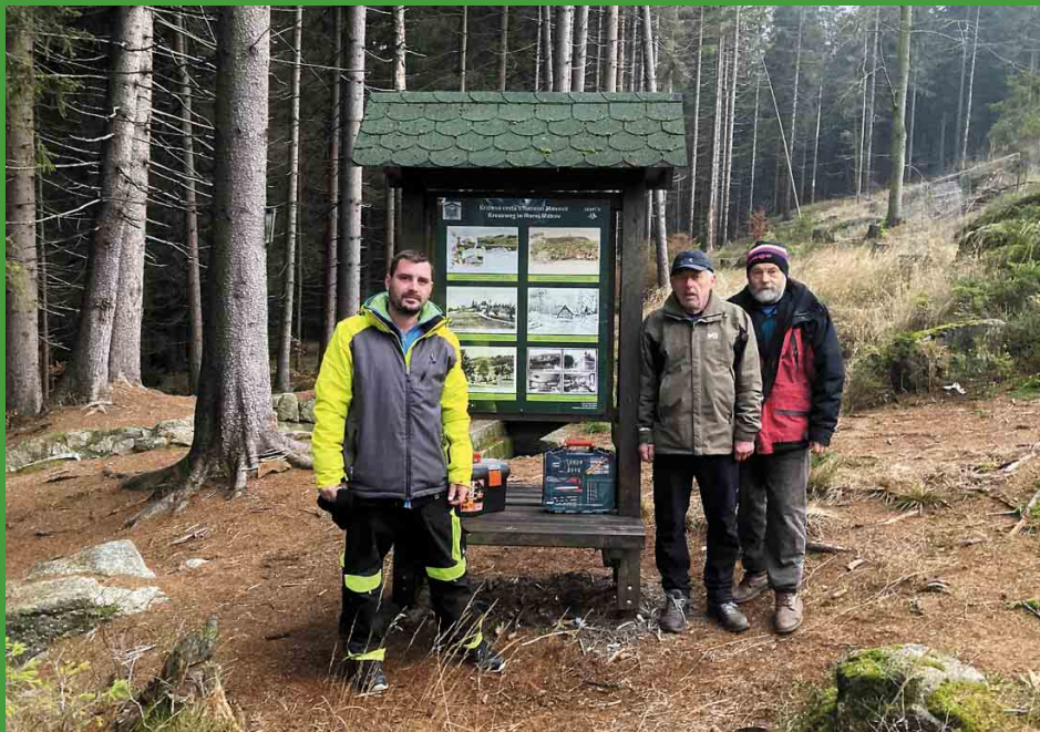
Dokončená obnova informačních tabulí u křižové cesty k Seibtově studánce.