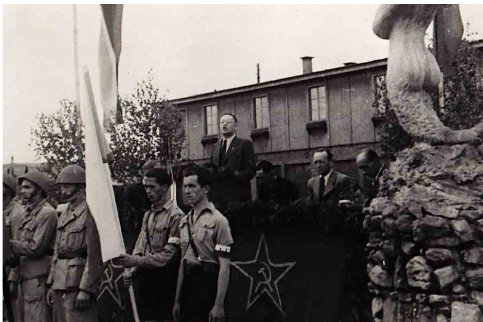
Socha Sirény (na fotografii vpravo) byla odstraněna někdy po roce 1948.

Jako úplně první drobnou památku bychom si měli připomenout fontánu s plastikou Sirény, která vznikla přímo v táboře, když byl ještě v provozu. Iniciativa vzešla zřejmě od vězňů – mnozí z nich byli zajati během Varšavského povstání, a ve znaku polského hlavního města je právě mořská panna. Velitel rychnovského tábora to asi nevěděl, považoval proto nápad na zhotovení plastiky za běžnou „výzdobu“, a vězňům se tak podařilo přímo do lágru propašovat odkaz na svůj domov, který jim symbolicky pomáhal překonávat útrapy a doufat ve šťastný konec. Někdy po válce Siréna zmizela a v posledních letech je předmětem bádání, kde by se mohla nacházet. Každopádně jde v rámci světa koncentračních táborů o zcela unikátní situaci – podobný objekt nalezneme snad jen v bývalém lágru Majdanek ve východním Polsku, kde plastika želvy měla vězňům symbolizovat, aby tamější nucenou práci pro nacisty vykonávali pomalu a okupanty tak sabotovali.