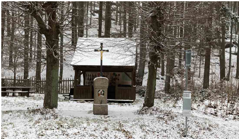
Obnovený kříž s první podzimní sněhovou nadílkou roku 2022.

Práce v Oldřichovském sedle budou dokončeny v jarních měsících roku 2023 celkovou úpravou okolí. Na jarní období také Spolek Patron plánuje slavnostní prezentaci, spojenou s požehnáním obnovené památky.