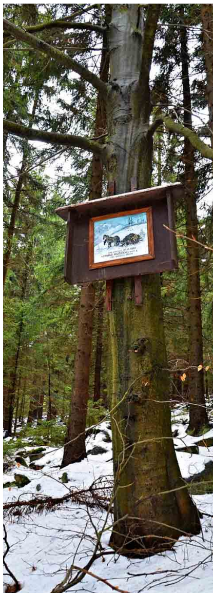
Mužičkova památka na Černostudničním hřbetu.

Přejeme vám hezké dny v Jizerských horách. Výbor Spolku Patron