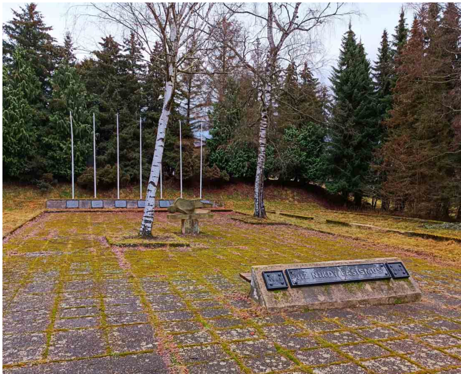
Hlavní pietní místo tvoří prostranství s pamětními deskami, sochou a ohraničené zbytky základů dřevěných baráků.