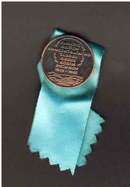
Medaile věnovaná památce obětem koncentračního tábora v Rychnově.