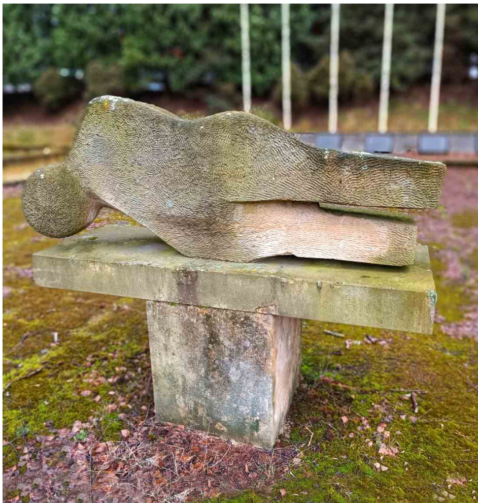
Detail sochy, která představuje zlomeného a poniženého člověka.

mělo jednat o rozsáhlý areál se zastřešenou budovou, masivním schodištěm a dalšími objekty. Tento plán se nerealizoval, byl ale vybudován pietní prostor věnovaný obětem koncentračního tábora. V roce 1983 probíhaly terénní práce, o rok později zřejmě přibyla symbolická socha umučeného vězně podle návrhu sochaře Aloise Hubičky. Dne 11. května 1985 pak byl odhalen celý areál navržený architektem Otto Mackem. Tvoří jej centrální shromaždiště, po bocích ohraničené symbolickými základy vězeňských baráků. Od silnice jej lemuje úvodní motto „1942 1945 Již nikdy fašismus“ a plastika vězně, na druhé straně pak rampa s textovými deskami (autorem prof. Jaroslav Hradecký) ve znění „Z vašeho utrpení náš svobodný život“ v jazycích