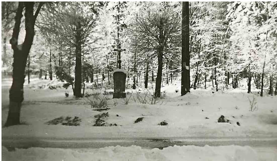
Kříž v zasneženém Oldřichovském sedle uprostřed zimy roku 1956.