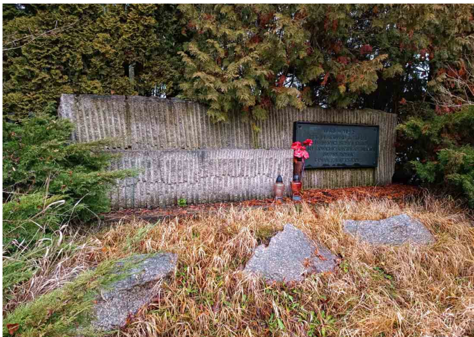
Pomník v areálu továrny je bez problémů přístupný, zasluhoval by však větší péči.

Dne 21. září 1984 se objevil další pomník. Tentokrát ve dvoře rychnovské továrny, kde dnes podniká firma Liberecké kotlární Hölter. Za války tu museli vězňové otrocky pracovat pro zbrojní podnik Getewent; v období socialismu továrnu provozovala firma ZEZ. Té byl v roce 1984 udělen čestný název „ ZEZ Rychnov u Jablonce, závod Českého svazu protifašistických bojovníků “. Pro tuto příležitost byla vydána pamětní medaile z autorské dílny profesora Jaroslava Hradeckého a byl odhalen pomník s textem „ 1943–1945 zde pracovali a trpěli příslušníci sedmi států, vězni koncentračního tábora Gross Rosen, pobočka Rychnov “. Objekt dodnes existuje v původní podobě a nachází se ve vnitřních prostorách firmy na továrním dvoře, je však dobře viditelný i od brány, přímo u podchodu pod rychnovským nádražím.