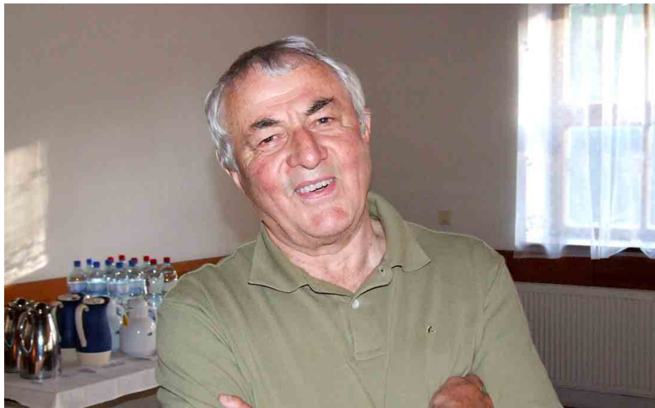
Sigi, setkání přátel v libereckém Koloseu.