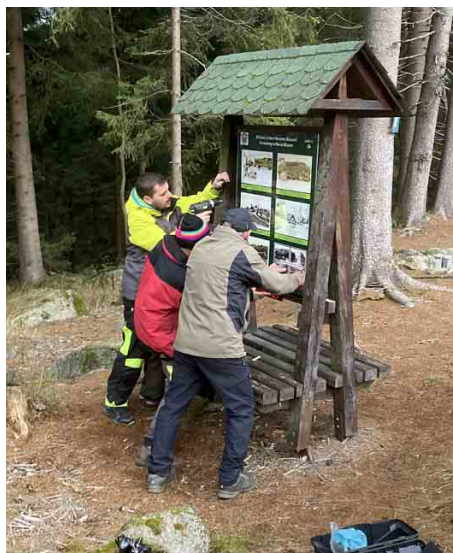
Nový informační panel byl osazen u Seibtovy studánky.