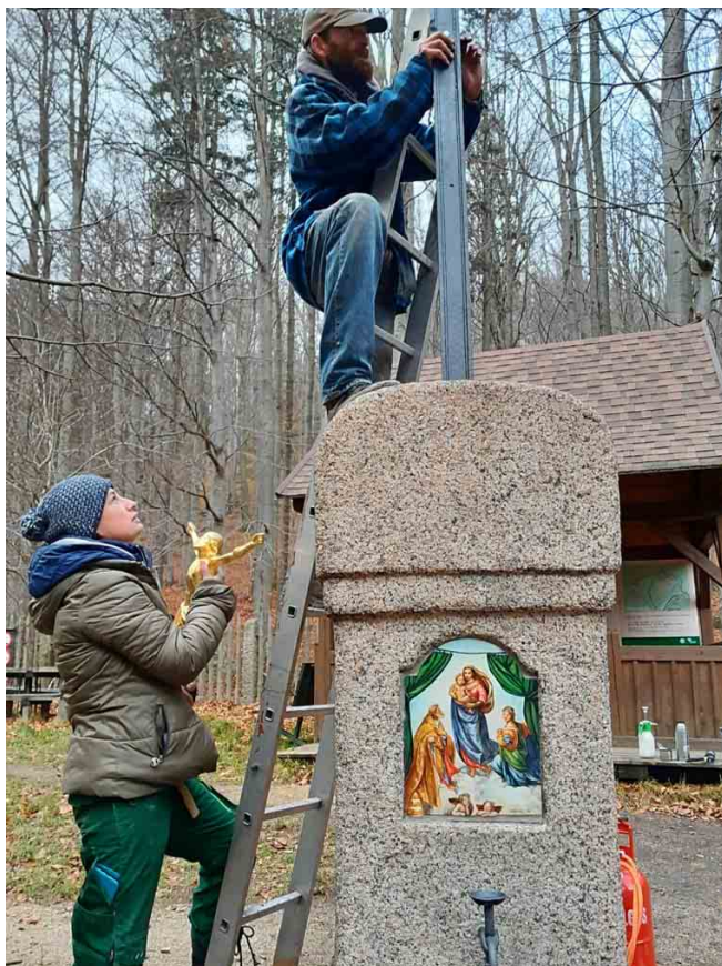
Instalace pozlacené sošky Krista na renovovaný kříž.

také stojánek pro umístění svíčky. Snad se vždy najde někdo, kdo ji zde rád zapálí. Památka je součástí Staré poutní cesty do Hejnic a nachází se na vrcholu sedla přímo naproti hospodě Hausmanka (U Kozy). Při obnově pomníčku jsme spolupracovali s restaurátorkou Vanesou Trostovou, kovářem