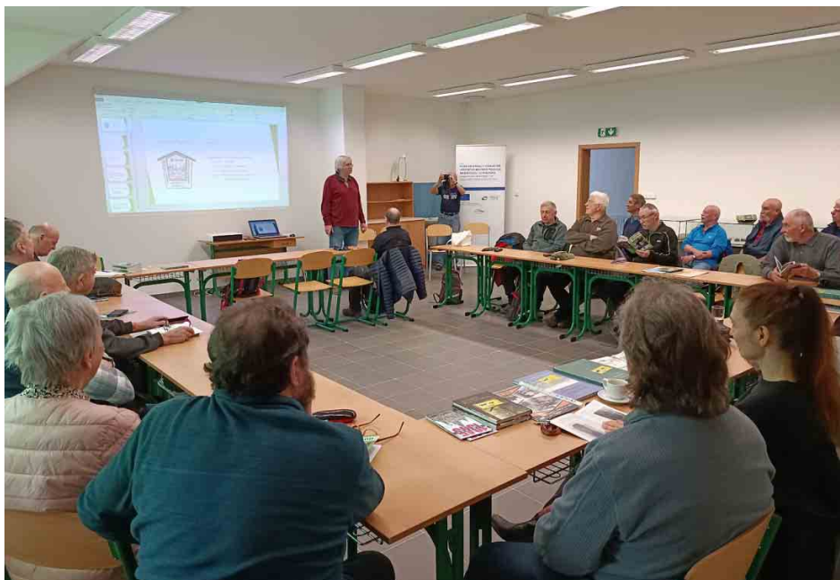
Výroční členská schůze se v roce 2022 poprvé konala v environmentálním centru Sylvatica.

Podrobný program schůze bude zveřejněn na webových stránkách Spolku Patron čtrnáct dnů před jejím konáním. Sledujte proto pozorně spolkový web a e-mailovou komunikaci.