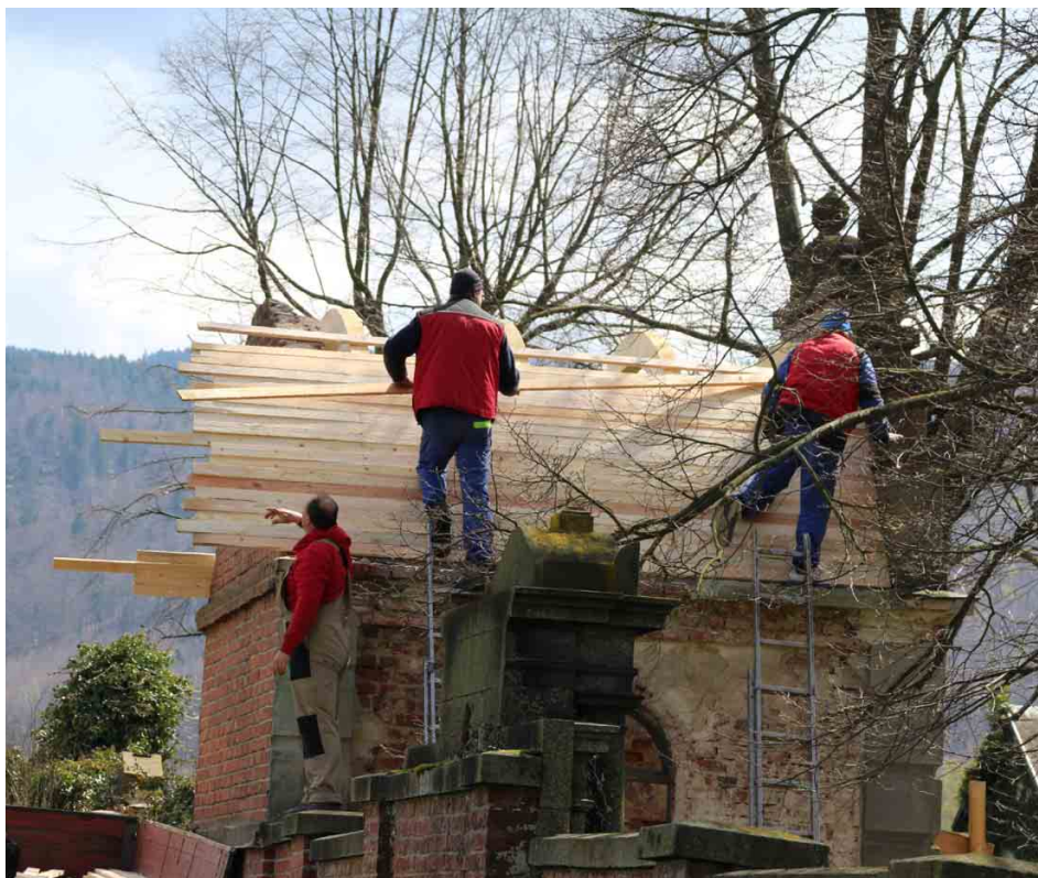
Obnova poškozené střechy byla pro úspěch celého projektu zásadní.