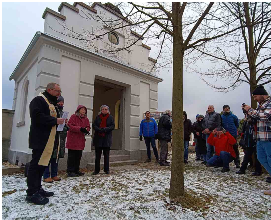
K slavnostnímu požehnání hrobky se 20. listopadu 2022 sešly desítky lidí.

V roce 2016 se obnovy hrobky ujal spolek Živo v Hájích s cílem ji postupně opravit. Krov byl směrem k přednímu štítu již úplně uhnulý a do hrobky přšelo. Vnější omítky byly opadané, prorostlé břečtanem, vnitřní téměř zničené. V jednom z oken zbyl zpuchřelý dřevěný rám, dveře se nedochovaly vůbec.