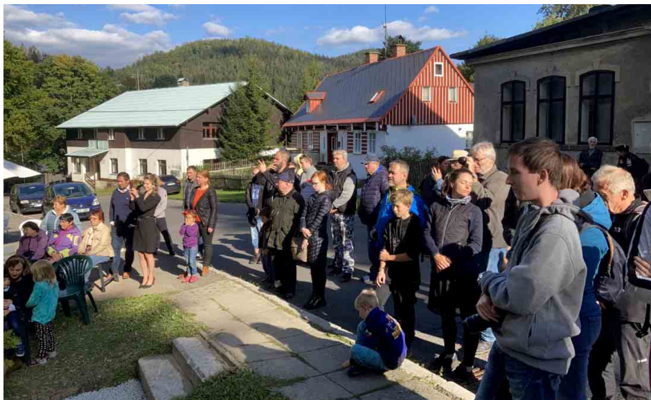
Slavnost přilákala desítky zájemců.