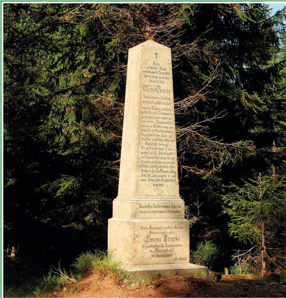
Pomník Porscheho smrti s obnoveným nápisem