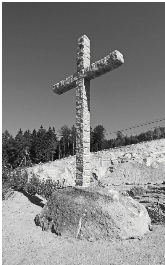
Hotový Kříž Práce na lomem Lednice