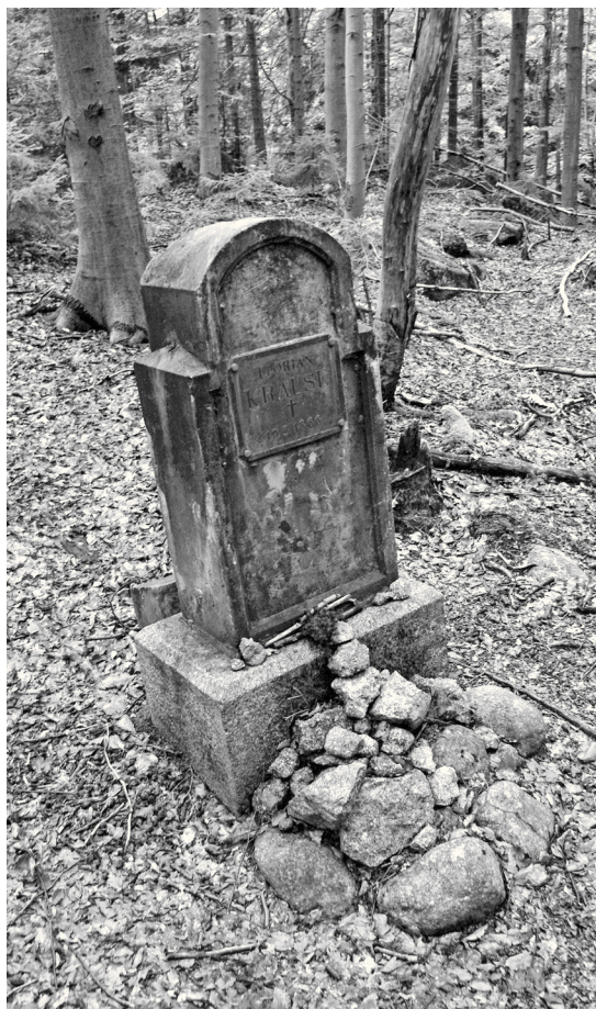
7. září 1999 – pomníček je složen pouze ze dvou dílů