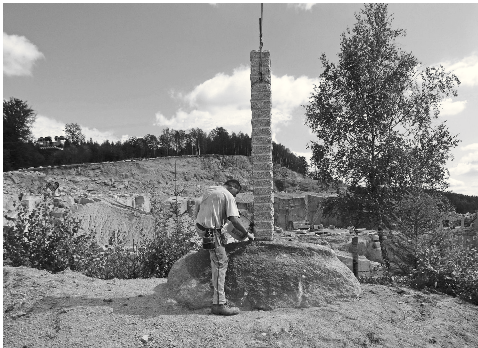
Založení kříže do „bludáku“ na okraji lomové jámy

V horkých dnech letošního léta se dalo pozorovat, že letitý kříž umístěný na hraně lomu Lednice se začíná naklánět (viz Patron 2/2016 – pozn. redakce). V té době se v mé partě zrovna vyráběly žulové menhiry pro náročného zákazníka. Z jejich délky okolo šesti metrů občas zbyl kus, tedy odlom, který evokoval myšlenky využít ho ke vztyčení. Nápad byl tedy na světě a jeho zrealizování bylo už, obrazně řečeno, dílem okamžiku.