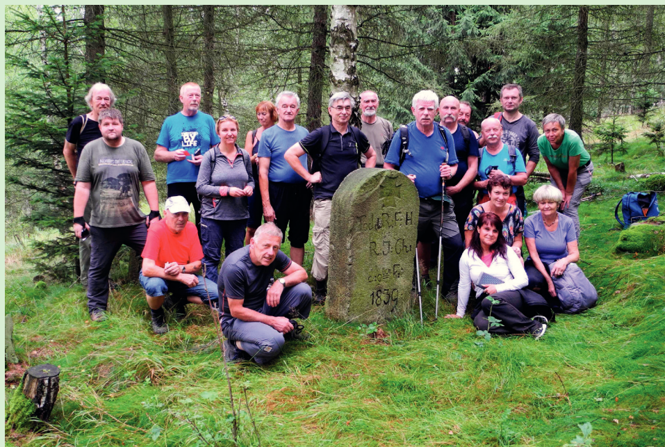
Spolkový výlet do okolí Šepiej Góry - zastavení u pomníku Hirta a Christa