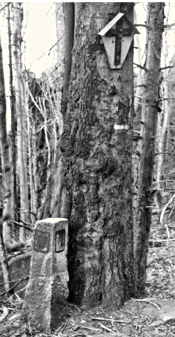
Pomníček U Pánaboha vyfotografovaný v roce 1979

V kartotéce Emila Nováka, který zde ještě kolem roku 1950 sám svážel na saních dřevo, jsem našel záznam s tímto popisem: