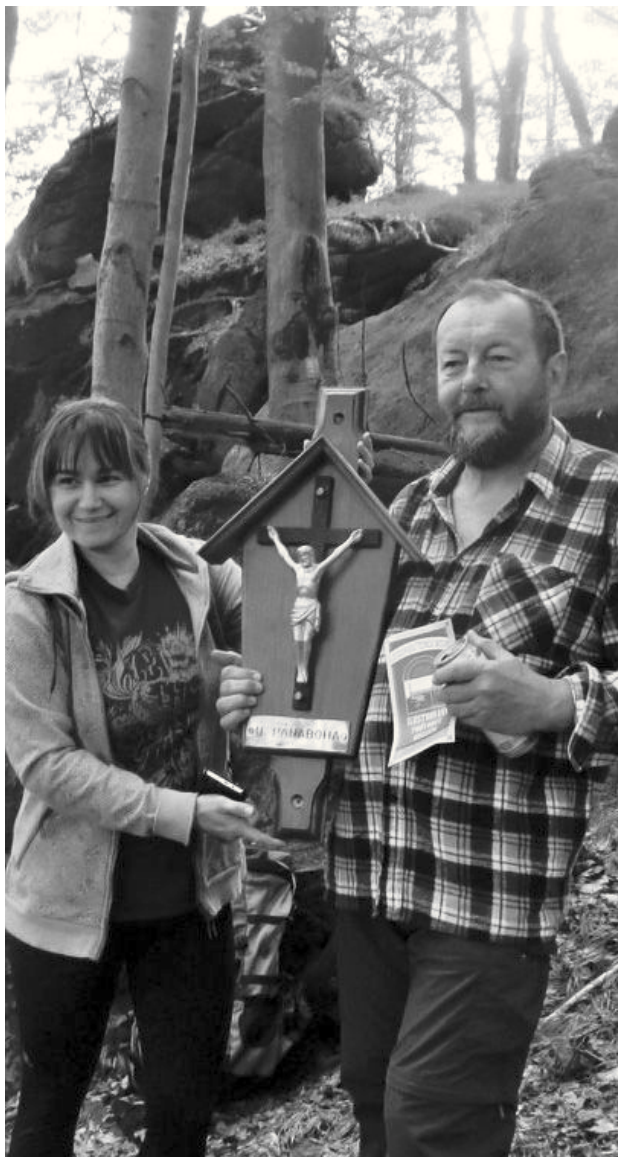
Nejnovější podoba památky U Pánaboha před upevněním na buk

Dolů jsme sestoupili krkolomnou cestou zvanou kdysi Böhmensteig, která má historický význam jako sváznice a na mapách se vyskytuje již před třemi sty léty.