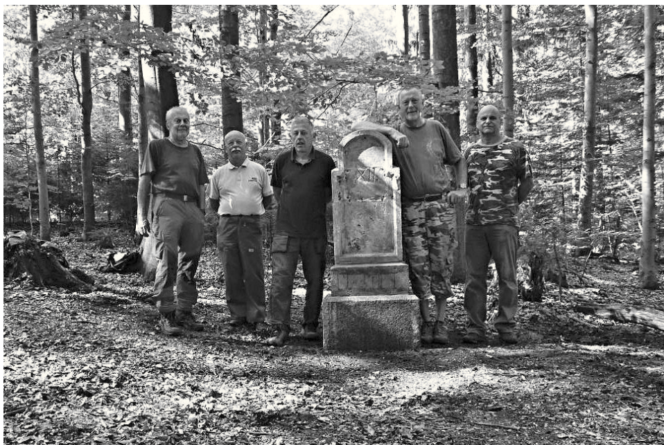
18. srpen 2017 – po desetiletích je pomníček znovu kompletní