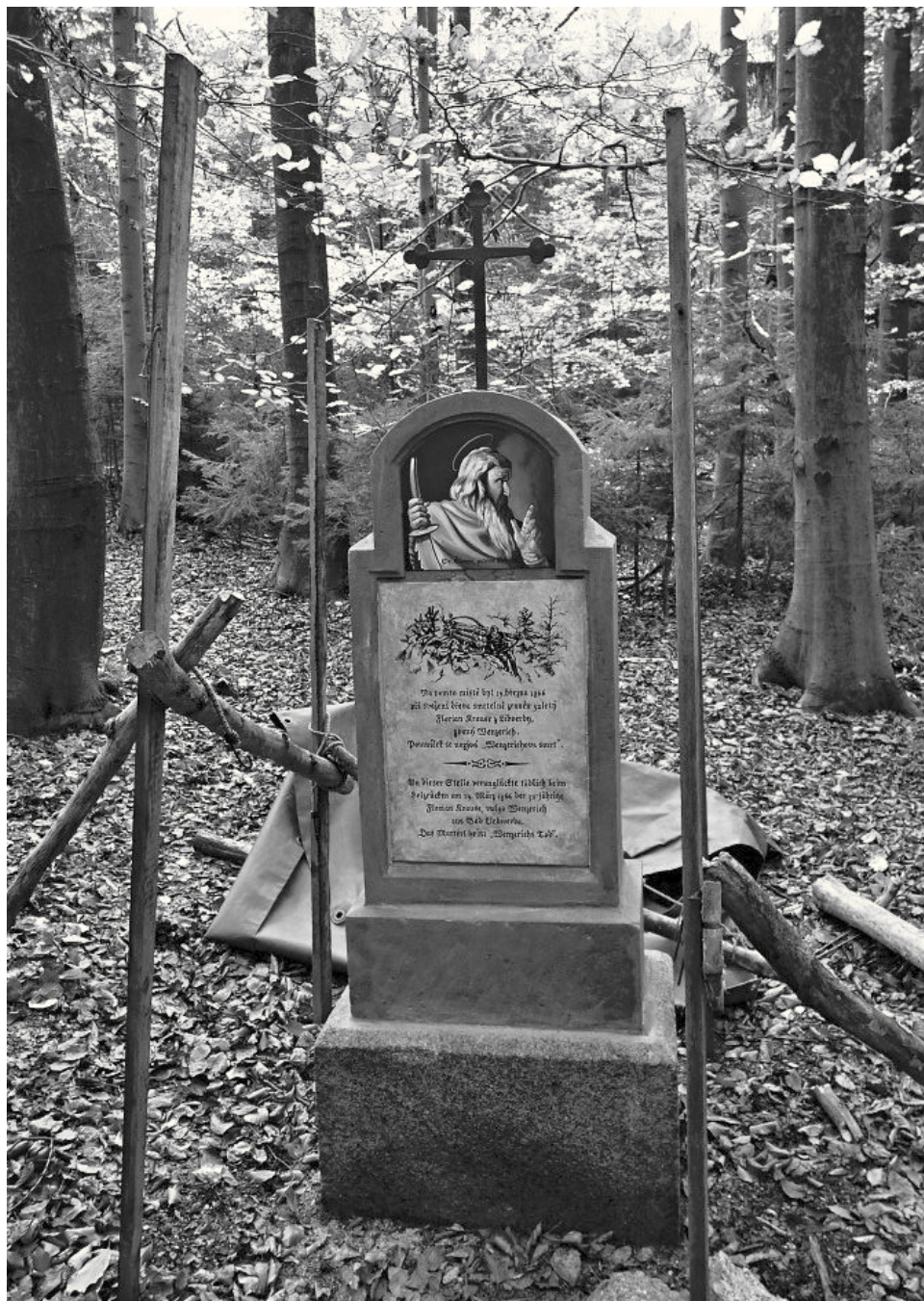
13. říjen 2017 – obnova památky je téměř u konce