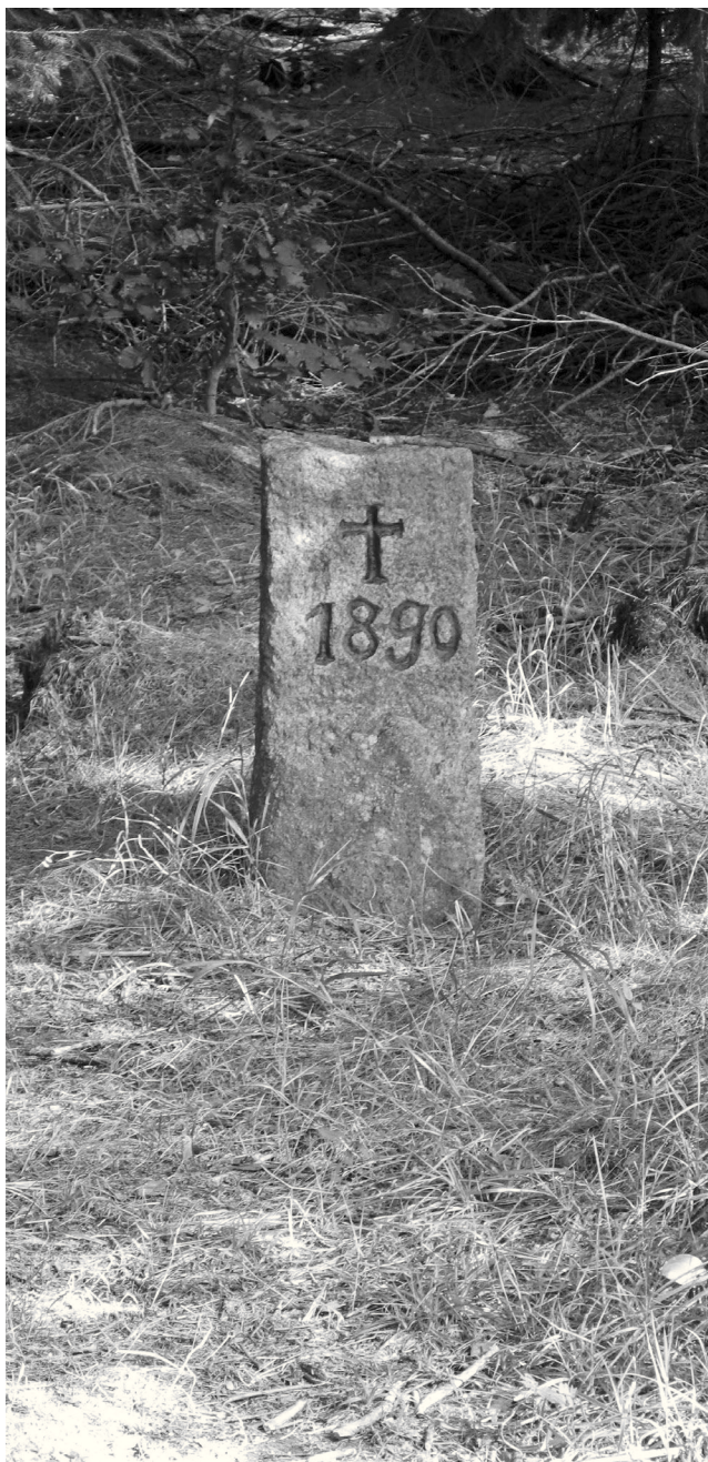
Nově objevený patník s letopočtem v blízkosti Wenigerova pomníku

Sestup zpět k lázeňskému městečku byl poměrně rychlý, třebaže turistická cesta, vedoucí kolmo k vrstevnicím, množstvím výmolů připomínala tankodrom. Její správce očividně nevyvíjí nejmenší snahu maskovat, že se ten hluboký, křivolaký a stále se rozšiřující úvoz za deště mění v koryto potoka. K Janově skále nás ovšem posléze zavedla pohodlná cesta, která jihovýchodním směrem téměř kopíruje šestisetmetrovou vrstevnici, aby nakonec vyústila v horní části Świeradówka. Z oné vyhlídky jsme ještě naposledy mohli obdivovat úžasnou scenérii této části Jizerských hor.