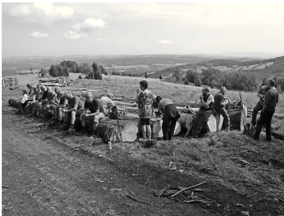
Polední odpočinek nedaleko bývalé Kesselschlossbaude

Nejdřív si vybavuji, jak mne napadlo ohlédnout se zpět tam, kde se na jihozápadním úbočí Sępiej Góry jedna ze świeradovských ulic změnila v lesní cestu. Naskytl se mi severní pohled na Smrk a Stóg Izerski, jejichž majestátnost a strmost mi vždy