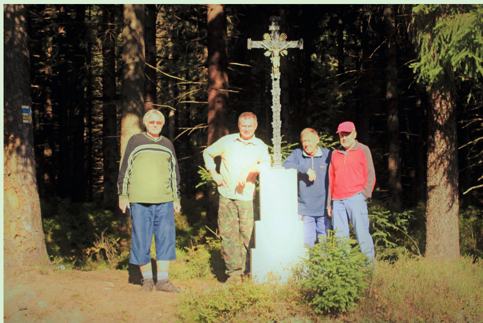
Gahlerův kříž byl po krádeži znovu obnoven 29. září 2017