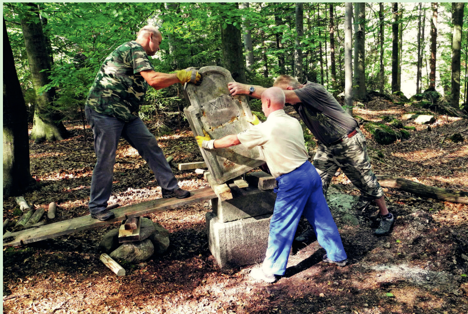
Obnova Wenzerichova pomníku pod Sedmitrámovým mostem