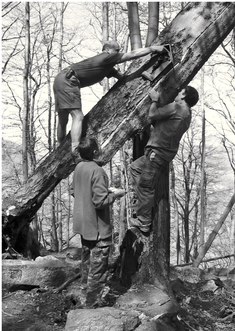
Akrobatické přemístění pomníčku na jiný strom v roce 2007