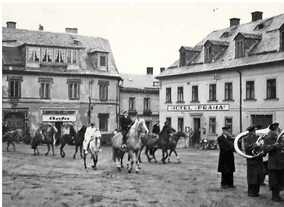
Dům č. p. 167 mezi prodejnou Baťa a hotelem Praha (cca 1946)