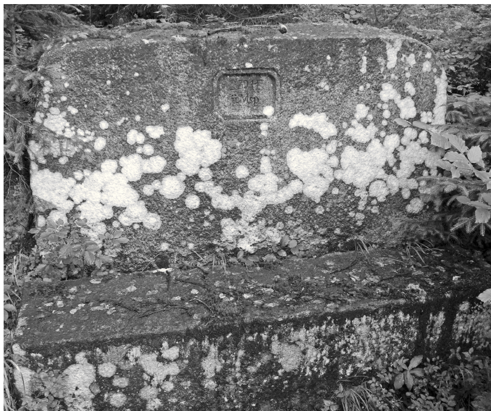
Výškový kámen nad hlavní silnicí nedaleko Jakuszyd