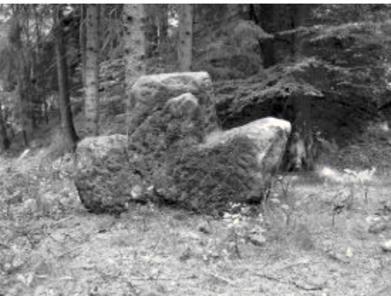
Poloha při příchodu na místo