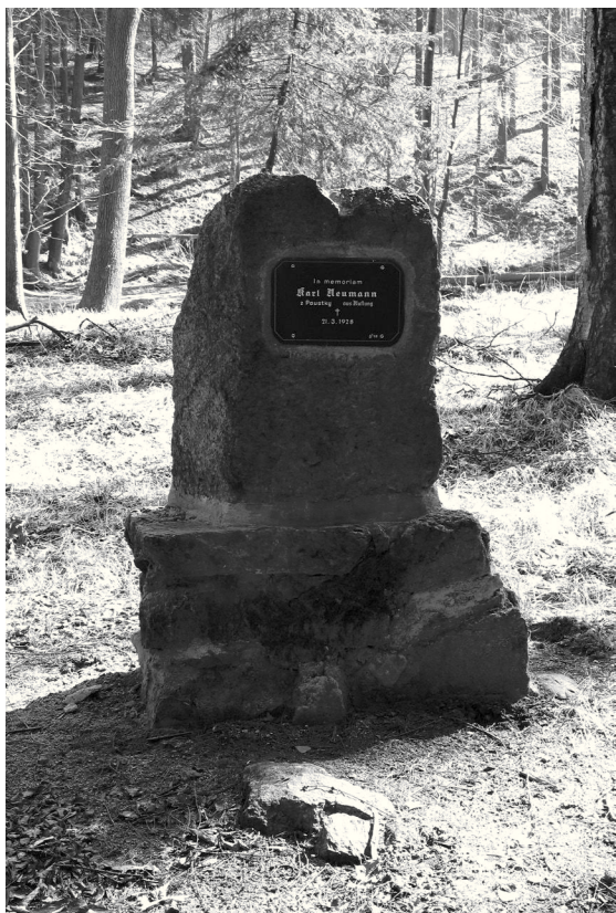
Neumannův pomníček na jaře 2012

EFFENBERGER, W. Z historie jednoho pomníčku. Frýdlantský zpravodaj . Ročník 2001, č. 9, str. 10.