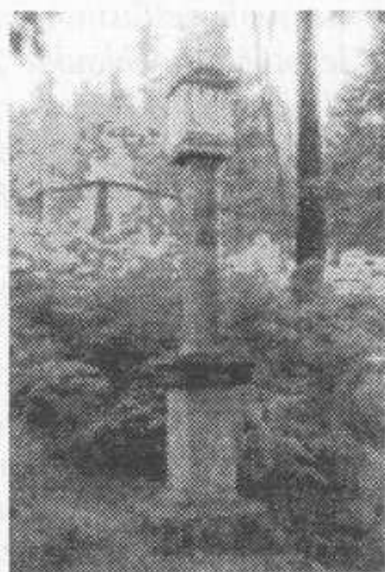
sloup sv. Jakuba

IHS je letopočet 1812, zřejmě rok úmrtí žebrajícího děvčete, ke kterému zde došlo.