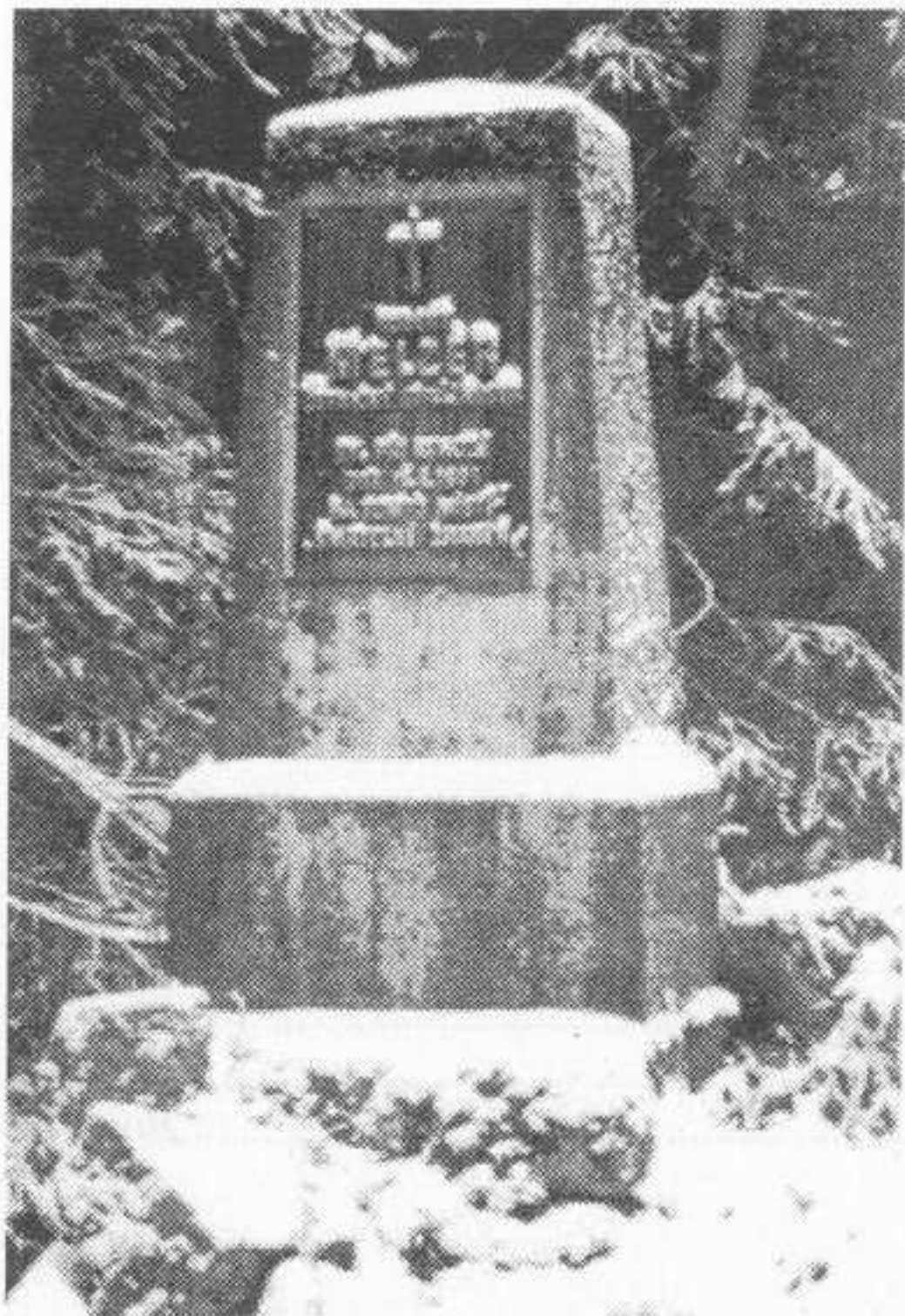
Foto Melzerova pomníku v zimním hávu

Všem příznivcům jizerskohorských pomníčků, členům našeho sdružení i všem lidem pod horami přejeme radostné prožití Vánočních svátků a šťastný vstup do nového roku » 2005 «