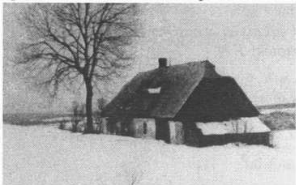
Stará hájenka č.p. 74

Dne 27. ledna roku 1933 rozvířila oblast kolem Nového Města pod Smrkem tragická zpráva o loveckém neštěstí, které se přihodilo tehdy třiapadesátiletému nadlesnímu Adolfu Pechovi z Nového Města pod Smrkem. Dobové frýdlantské i jablonecké noviny ve dnech 28. ledna a 1. února roku 1933 psaly o „politováníhodném neštěstí při lovu“.