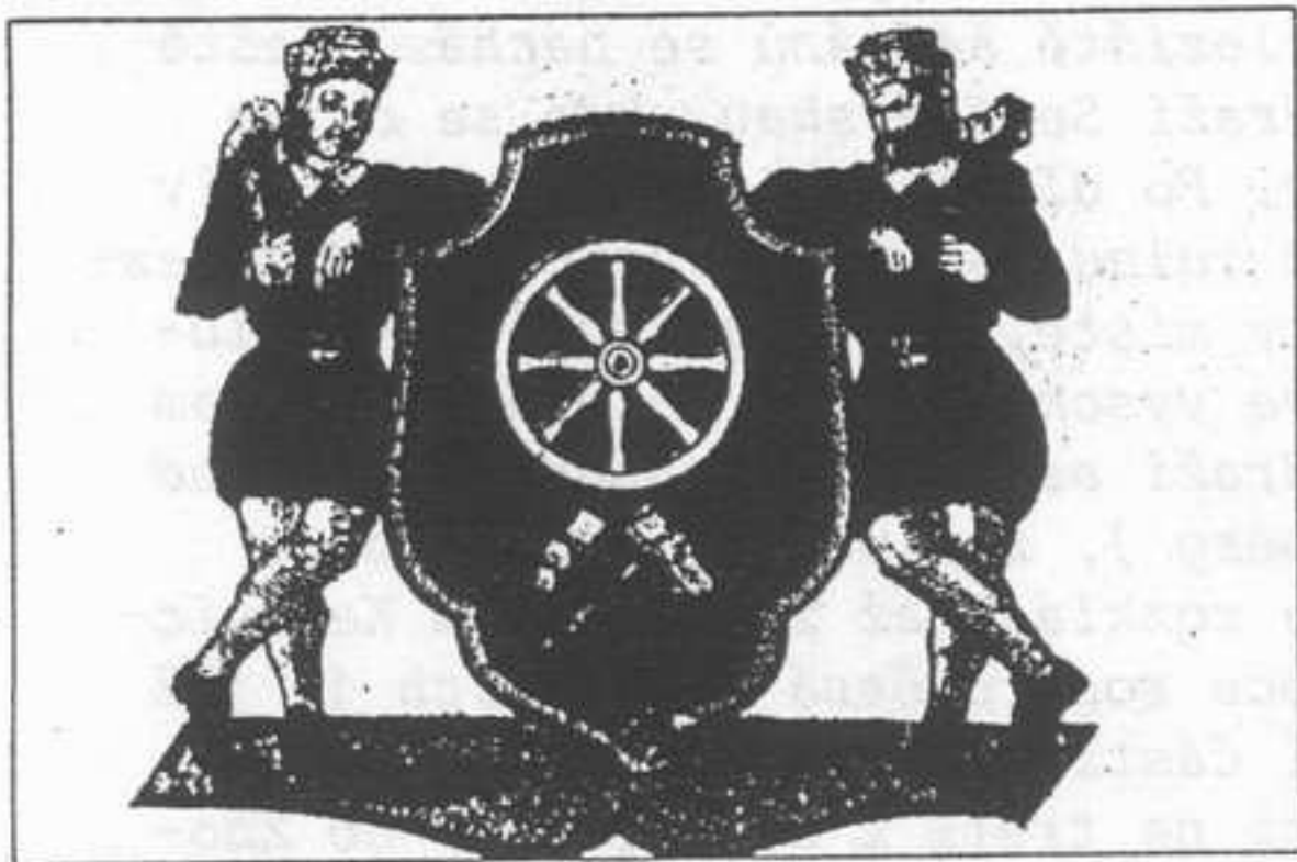
Znak Nového Města z roku 1592