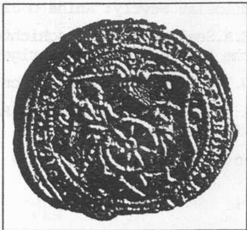
pečeť Nového Města z roku 1759

Pro lepší představivost o počtu starých dolů a štol vůbec, uvádím přehled jejich názvů tak, jak byly známy v době vydání vlastivědné literatury o Novém Městě pod Smrkem, tedy v letech 1927 - 1934.